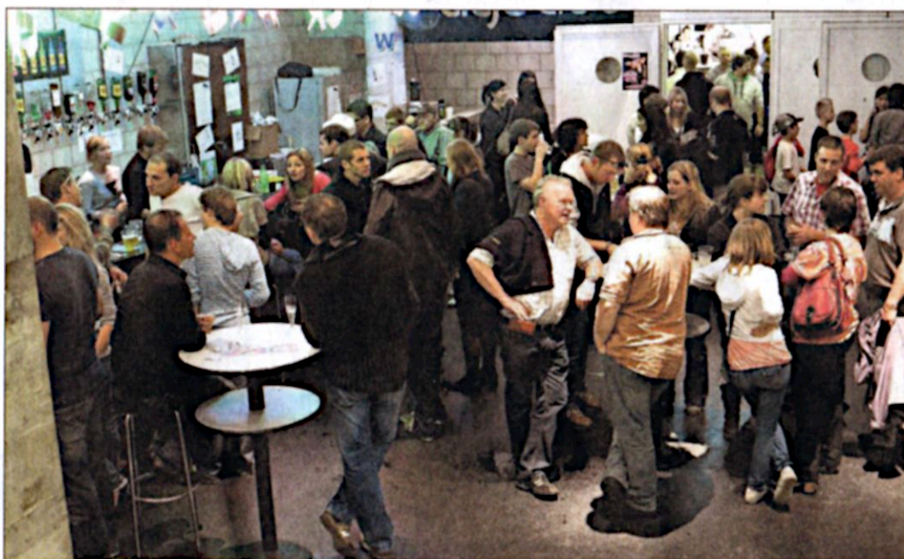
La Foire du Jura, c'est toujours une conviviale occasion de tisser un réseau social, pour de vrai.

► Mais la culture tout court est aussi de la fête, puisque le Centre culturel régional de Delémont (CCRD) vient y souffler ses quarante bougies.